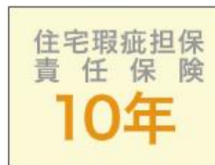
住宅瑕疵担保責任保険