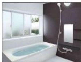
浴室暖房乾燥付 システムバス