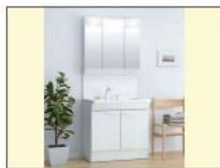
シャワー水栓付き 洗面化粧台