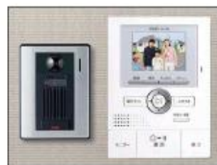
カラーモニター付 インターホン