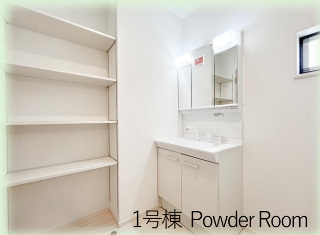
1号棟 Powder Room