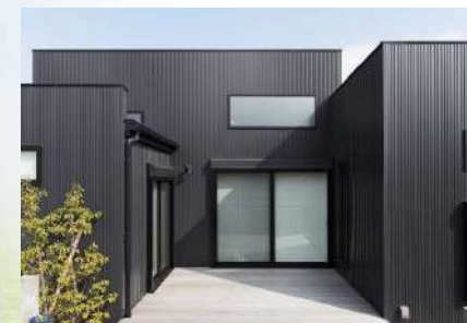
※外壁材（ガルバリウム）

夏は涼しく、冬は暖かい毎日を暮らしやすく快適にしてくれます！家族の健康を支える&環境にも家計にもやさしい家、ハイグレード住宅です！