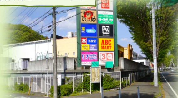
飲食店が充実しているショッピングセンターです☆